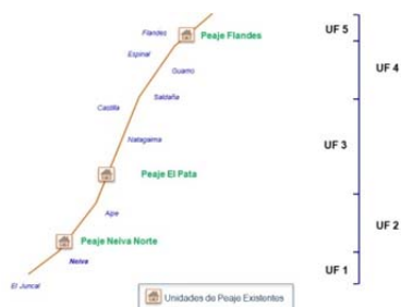
Figura 1. Trazado del proyecto

El proyecto se encuentra ubicado en un 58 % en el Departamento del Tolima y en un 42 % en el Departamento del Huila, con una longitud aproximada de 194 km. Inicia en el Departamento del Tolima en Flandes, sector en el cual se tiene la conexión con la ruta 40 (Bogotá - Ibagué - Cajamarca) entre Flandes y el Espinal. Pasa por los Municipios de El Espinal, El Guamo, Saldaña, Castilla (Corregimiento) y Natagaima en el Departamento del Tolima, y Aipe en el Departamento del Huila, desviando en la Ciudad de Neiva por el costado occidental hacia el corregimiento El Juncal para conectar finalmente con la Ruta 45, en cercanías al Peaje los Cauchos (Municipio de Rivera).